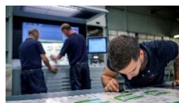
Fabricación de packaging secundario para la industria farmacéutica y cosmética www.essentrapackaging.es