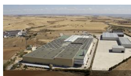
Fabricación de envases, embalajes y plancha de cartón ondulado www.avancecarton.com