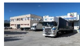
Empresa española líder en fabricación de prospectos farmacéuticos y cosméticos www.graficaszurita.com