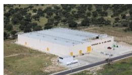
Especialistas en material de envase primario para la industria farmacéutica y médica www.grupoenteco.es